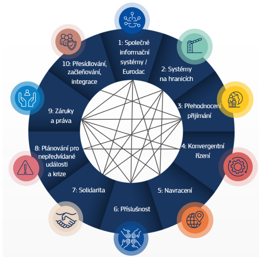
Obrázek 2: Deset základních prvků při provádění hlavních závazků Paktu o migraci a azylu.

Každý základní prvek zahrnuje právní závazky a jejich důsledky pro dokončení regulačního rámce, správní postupy, organizaci a lidské i infrastrukturní kapacity, které musí členské státy, Komise a agentury EU provést.