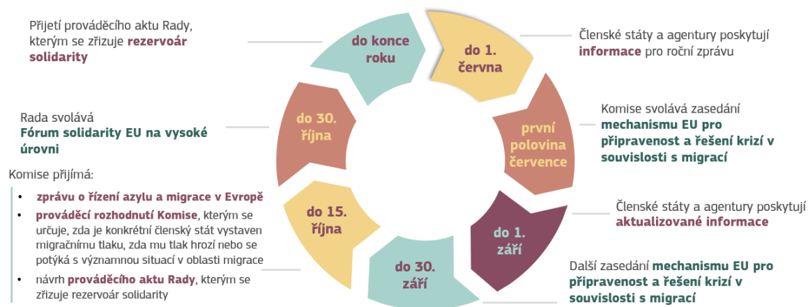
Obrázek 3: Roční cyklus řízení migrace

Mnohá opatření, která vyžaduje provádění ročního cyklu solidarity, je třeba zavést na úrovni Unie. Komise učiní odpovídající kroky nezbytné pro první roční cyklus řízení migrace a přijme veškerá nezbytná právní, správní a operativní opatření, aby zajistila bezproblémový průběh jednotlivých kroků ročního cyklu, včetně praktického uplatňování prvního ročního rezervoáru solidarity, který musí Rada přijmout na konci roku 2025 .