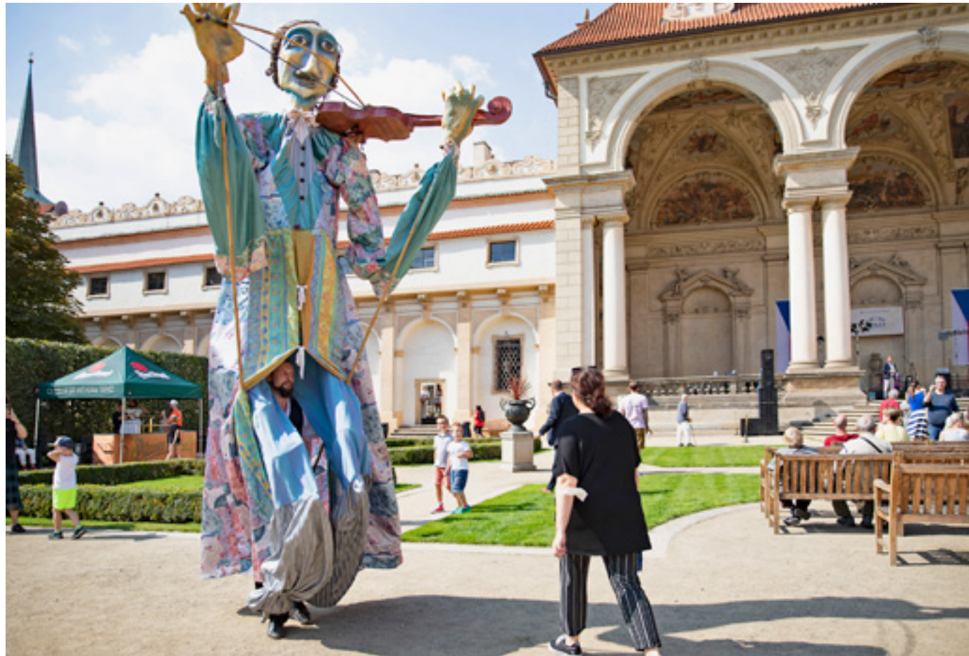
V září se opět uskutečnilo tradiční setkání senátorek a senátorů s občany. Nechyběl ani doprovodný kulturní program.