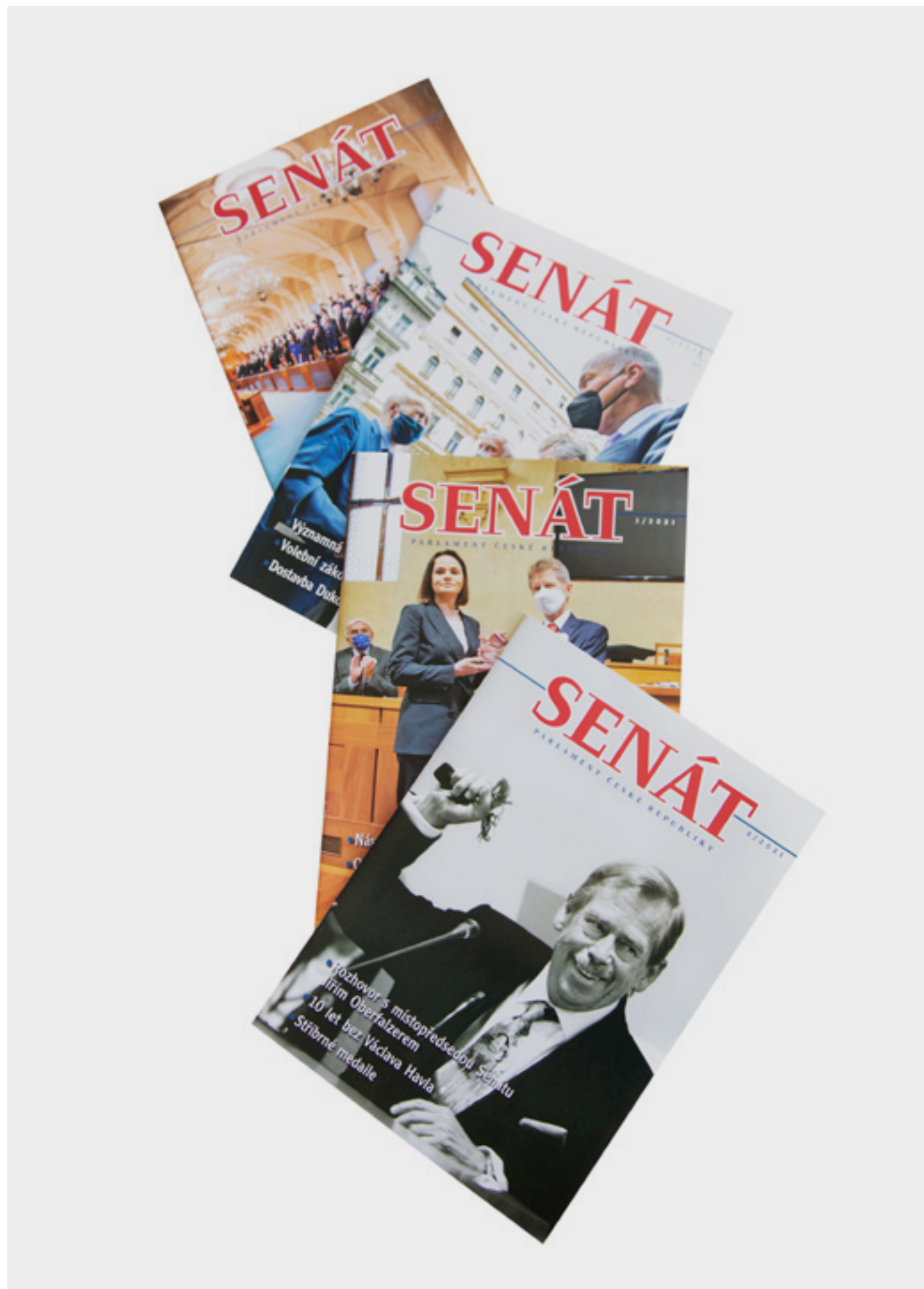
V průběhu roku 2021 vyšla další čtyři čísla časopisu Senát. Od svého vzniku v roce 1997 tak bylo vydáno celkem již 97 čísel.