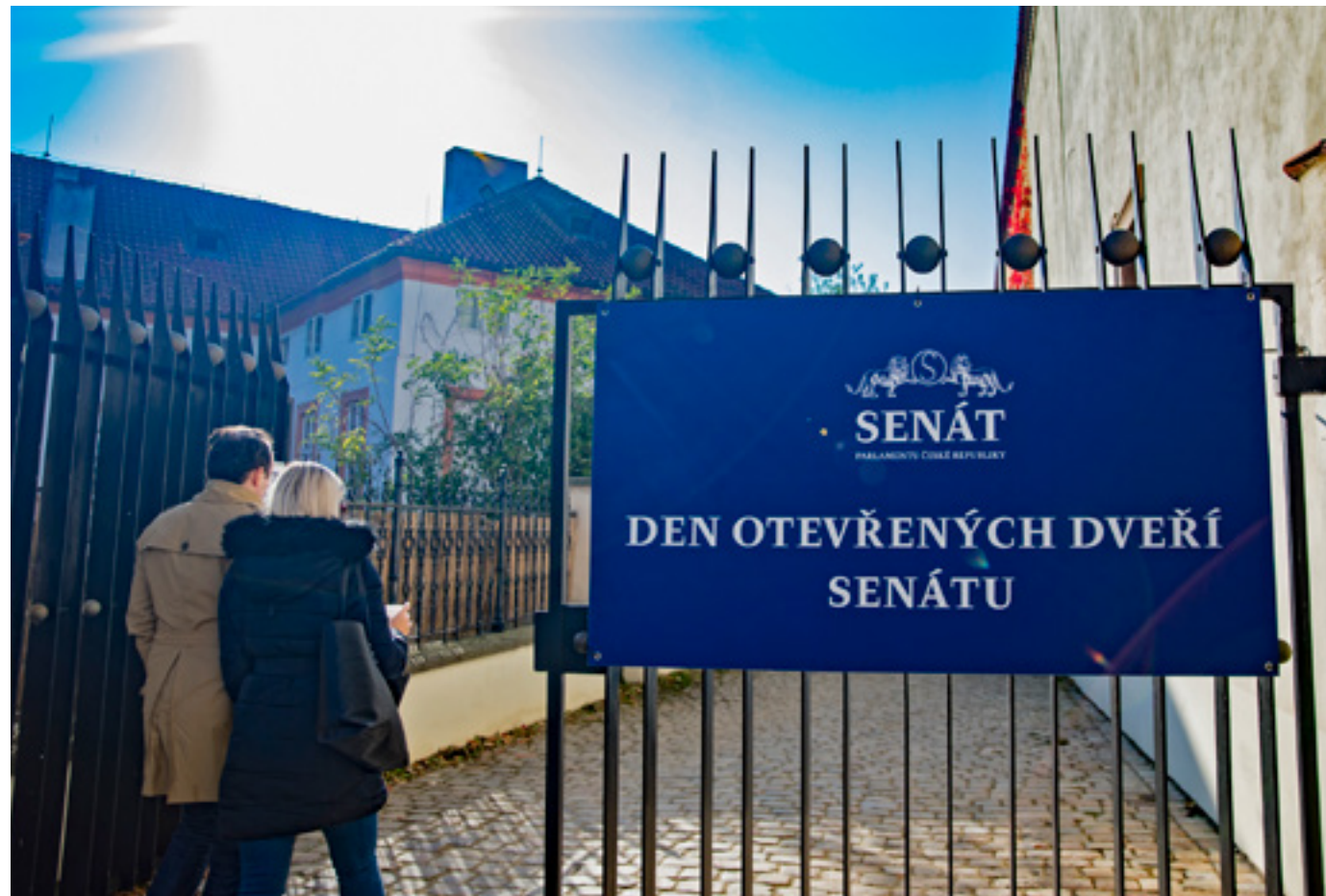
Po pauze způsobené pandemií se v Senátu 28. října opět konal Den otevřených dveří .