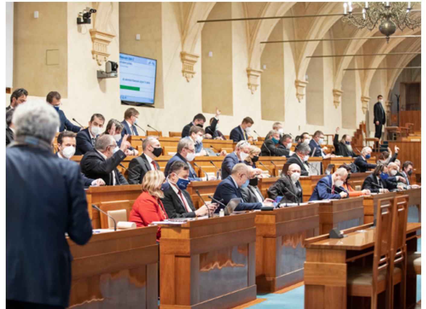
Senátorky a senátoři se na schůzi poprvé v roce 2021 sešli 7. ledna. Jednalo se o v pořadí 4. schůzi ve 13. funkčním období.