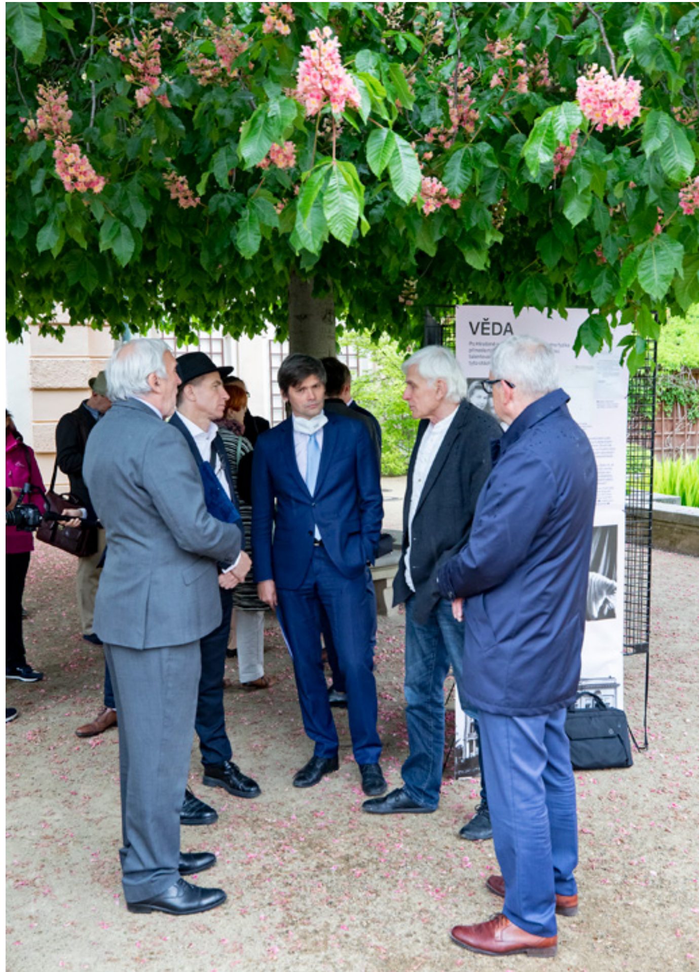
Vernisáž výstavy Andreje Sacharova Člověk Epoque ve Valdštejnské zahradě.