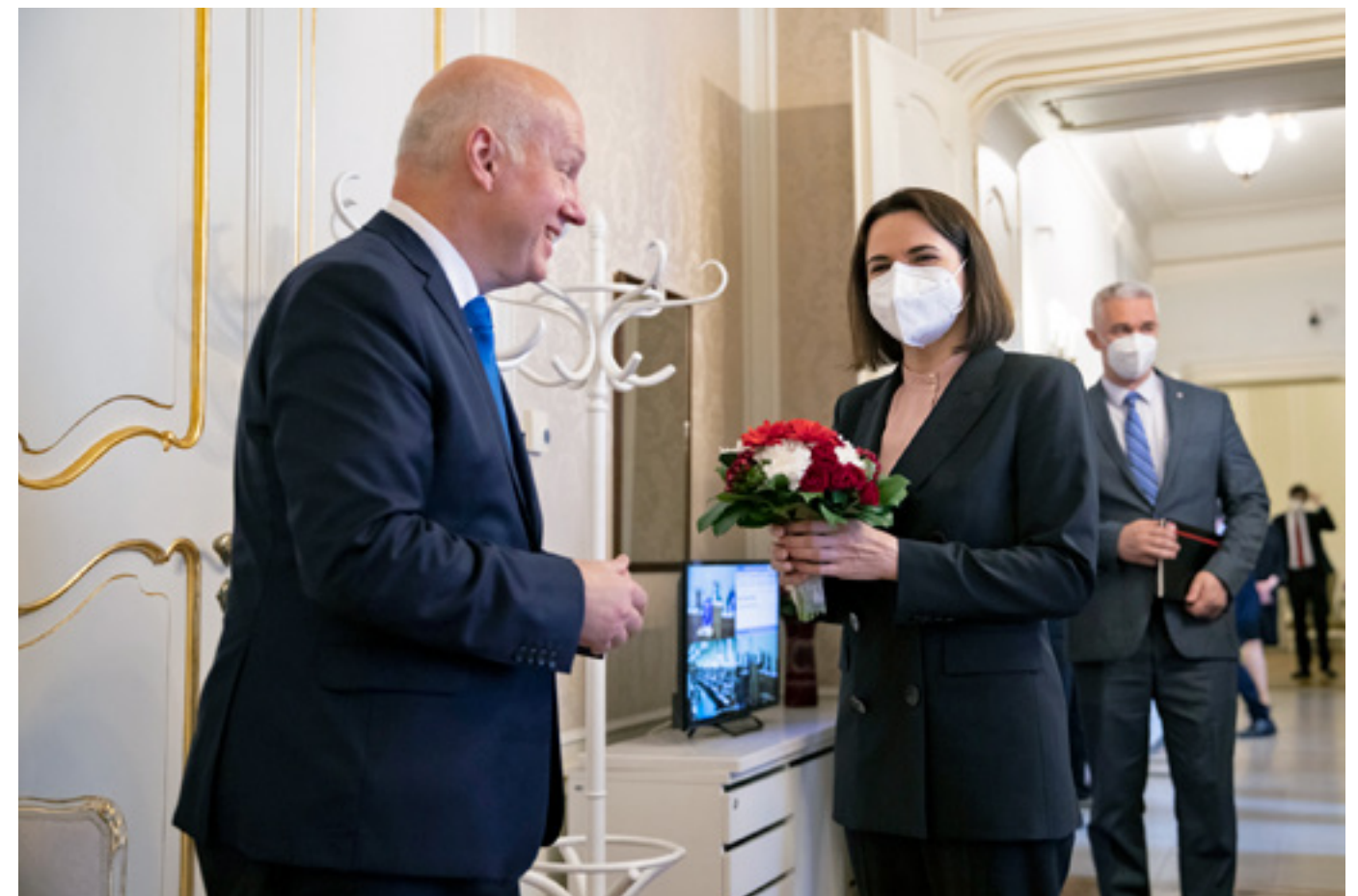
Svjatlanu Cichanouskou uvítal v Senátu i předseda zahraničního výboru Pavel Fischer.