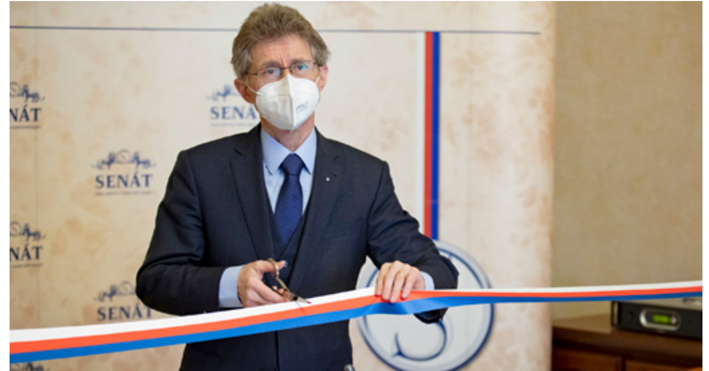
Předseda Senátu Miloš Vystrčil na dálku zahajuje výrobu respirátorů na lince, kterou českému státu daroval Taiwan.