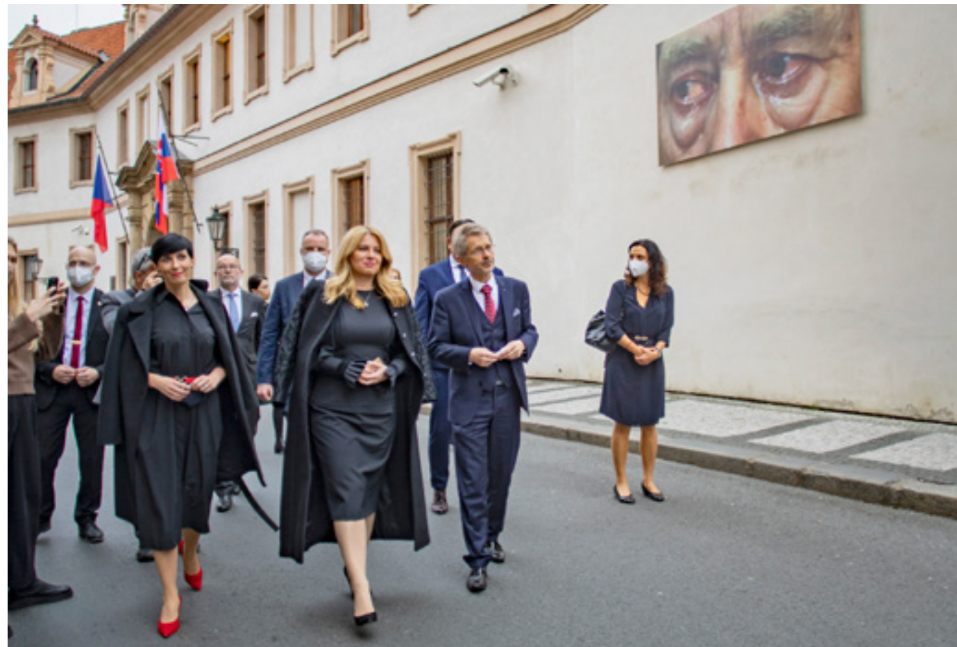
Výstavu o Václavu Havlovi si při své návštěvě v ČR prohlédla i slovenská prezidentka Zuzana Čaputová. Na snímku s předsedou Senátu Milošem Vystrčillem a předsedkyní Poslanecké sněmovny Markétou Pekarovou Adamovou.