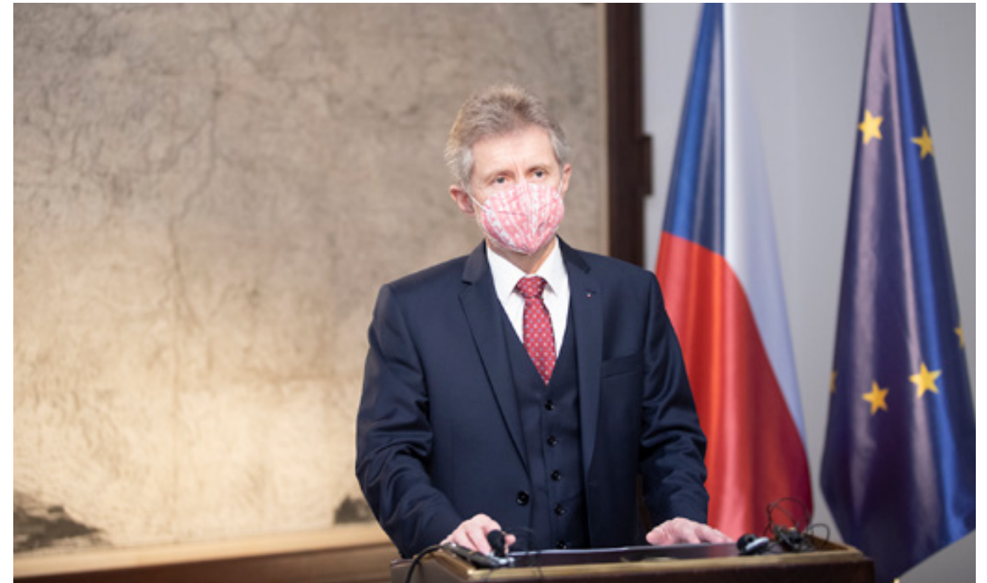
Předseda Senátu Miloš Vystrčil v živém přenosu vystoupil s novoročním projevem. Navázal tak na tradici, kterou založil jeho předchůdce Jaroslav Kubera.