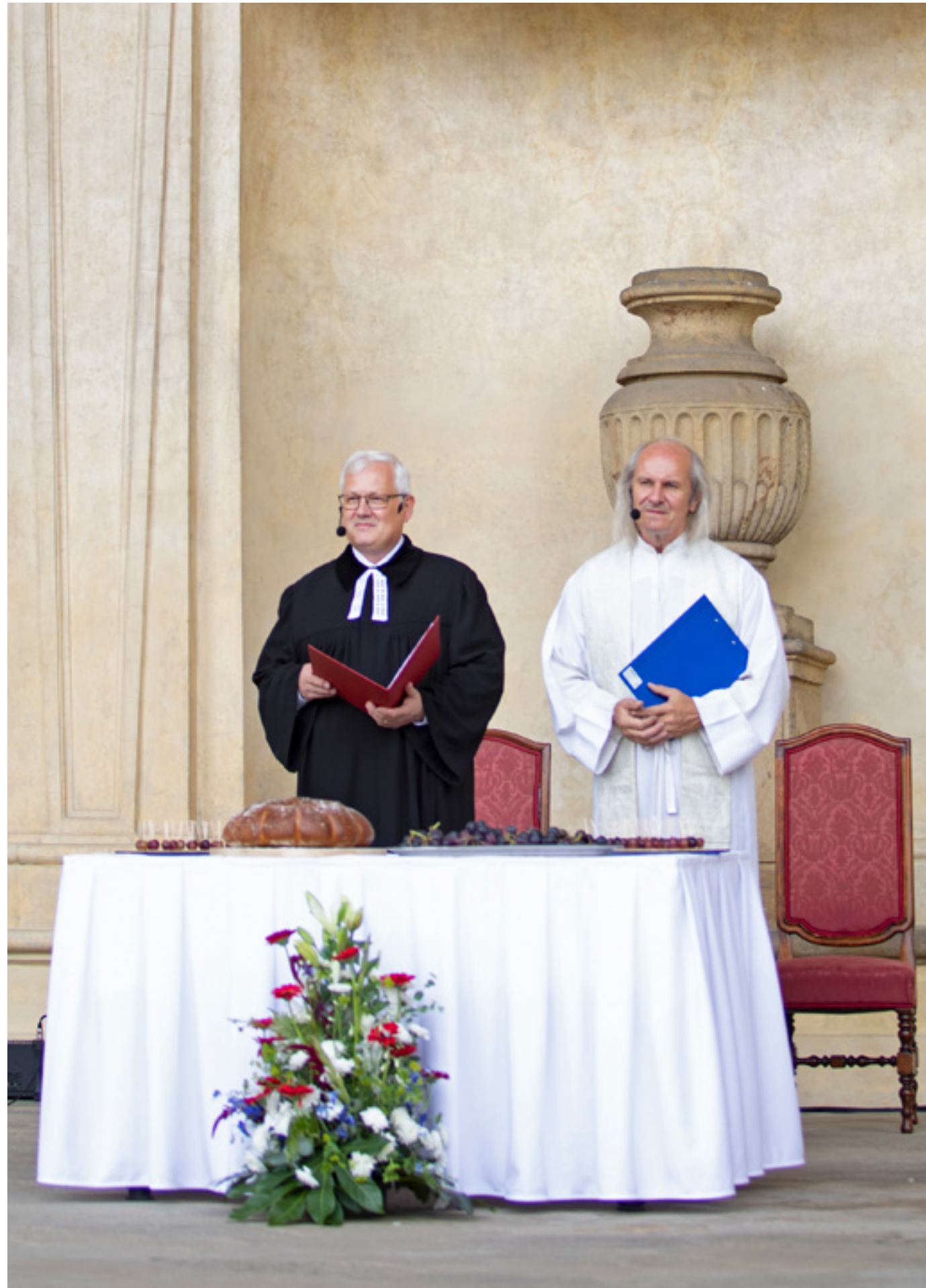
Ekumenická bohoslužba u příležitosti Dne české státnosti .