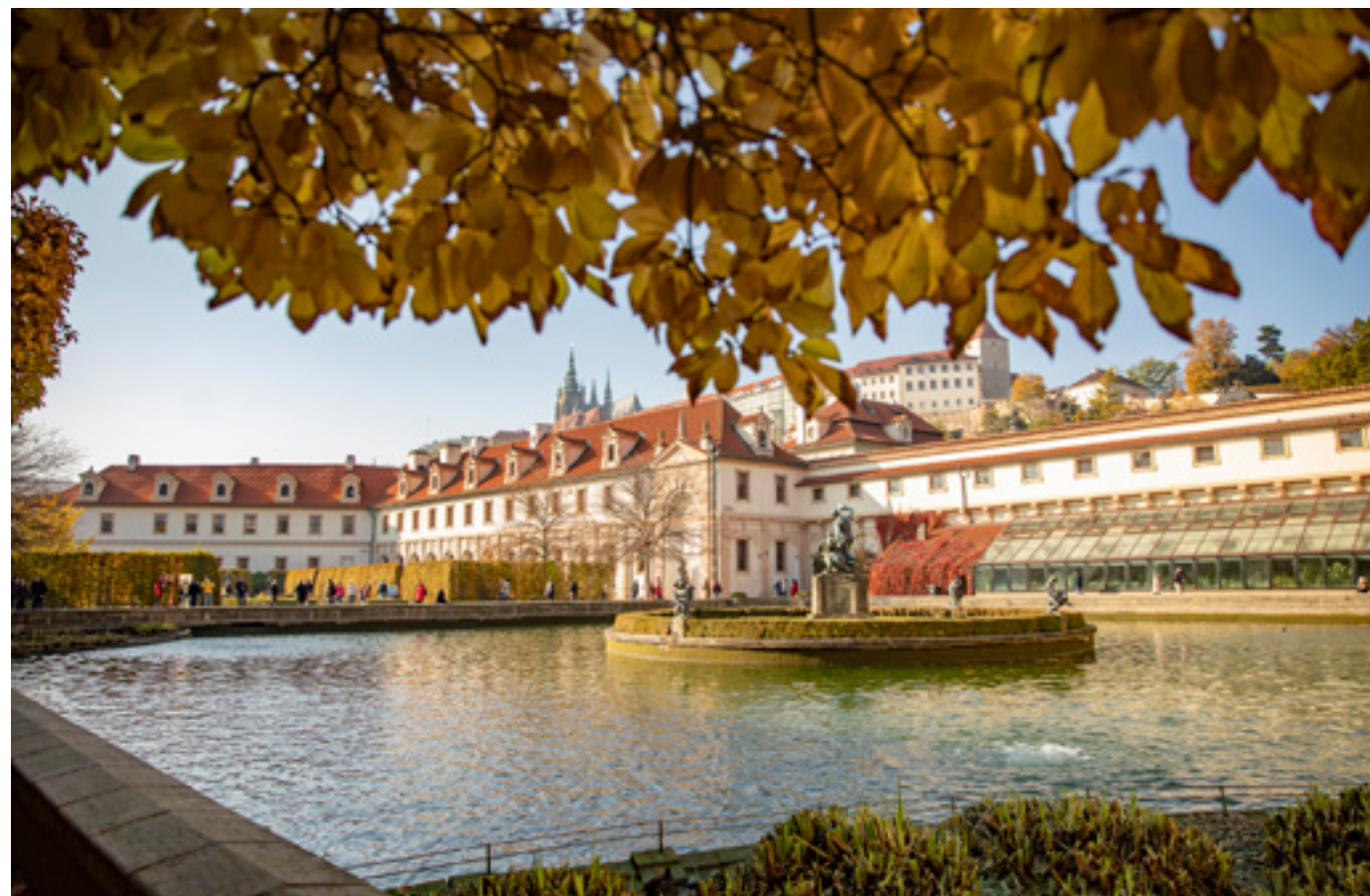
Lidé si mohli prohlédnout Valdštejnský a Kolovratský palác, nahlédnout do Jednacího sálu i do pracovny místopředsedy Senátu. Otevřena byla také Valdštejnská zahrada.