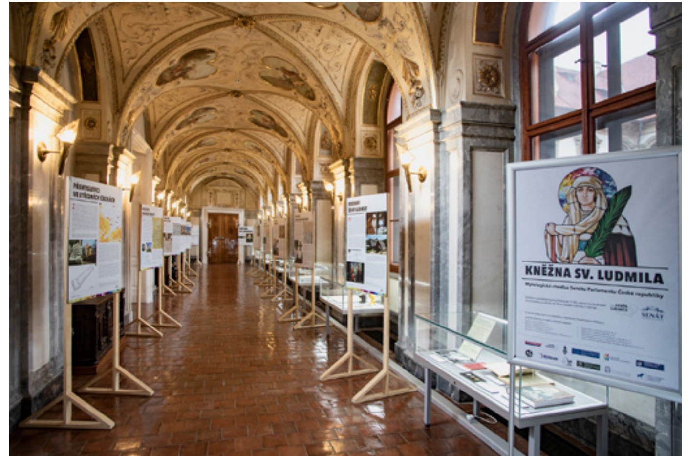
Výstava Kněžna sv. Ludmila připomněla výročí 1100 let od jejího úmrtí.