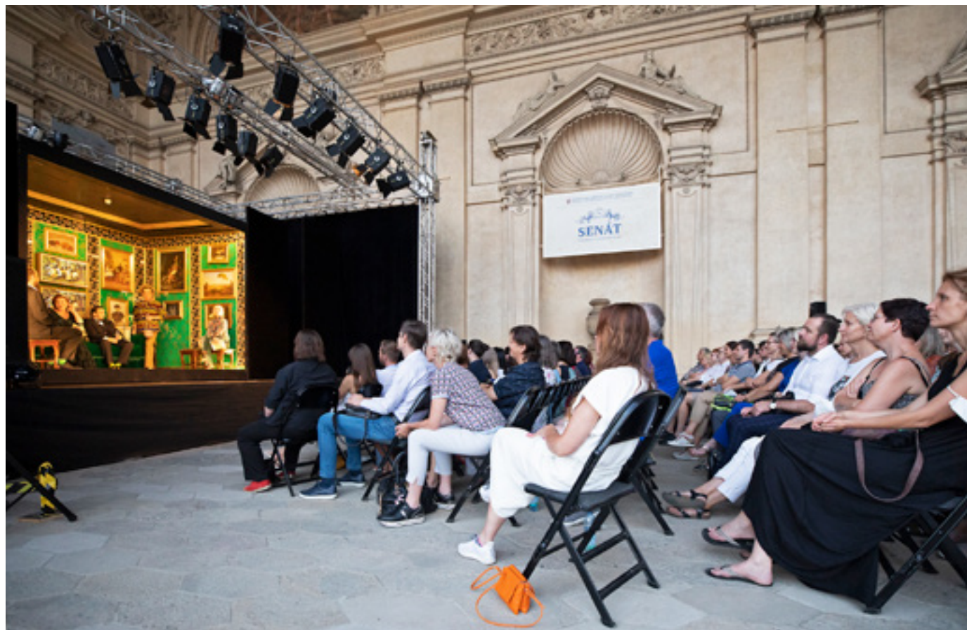
Senát pro kulturu hostil také inscenaci Mýcení , kterou ve dvou reprízách uvedlo Divadlo Na Zábřadlích.