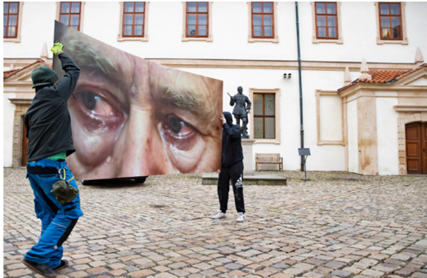
Instalace výstavy Jiřího Davida Bez soucitu k příležitosti 10. výročí úmrtí Václava Havla.