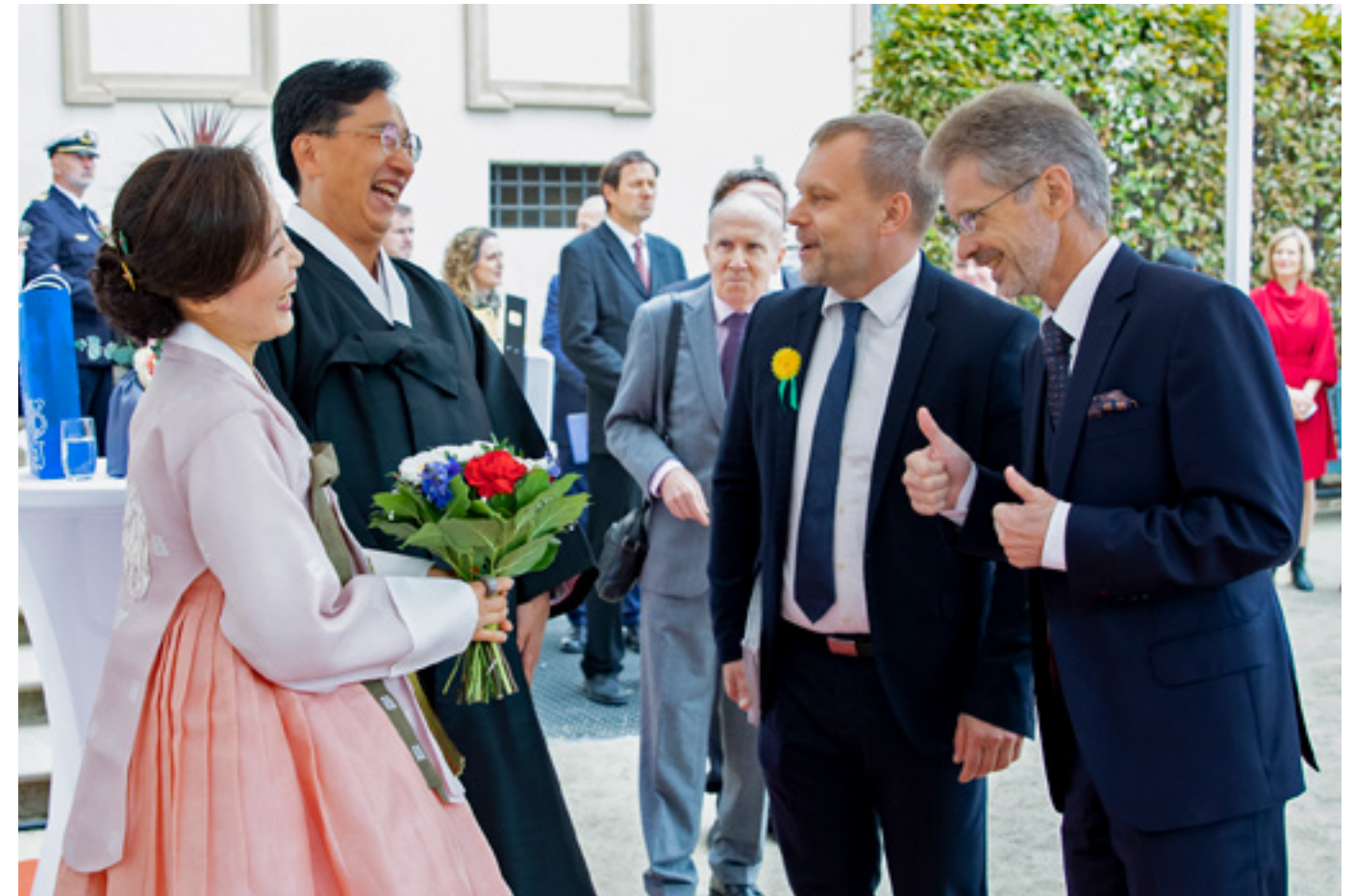
Recepce u příležitosti státního svátku Korejské republiky.