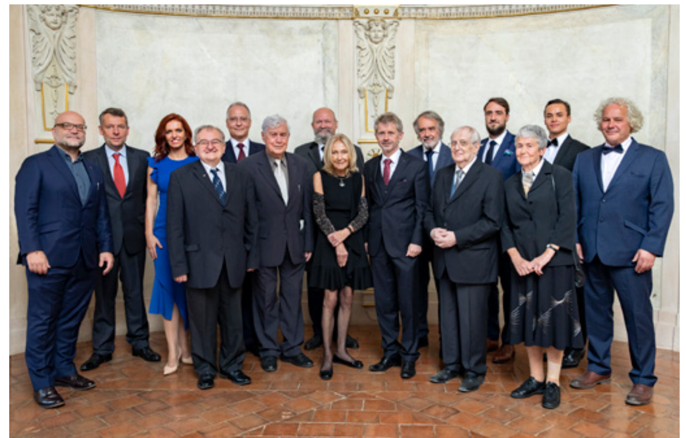
Předseda Senátu Miloš Vystrčil s lauréáty Stříbrných medailí za rok 2021.