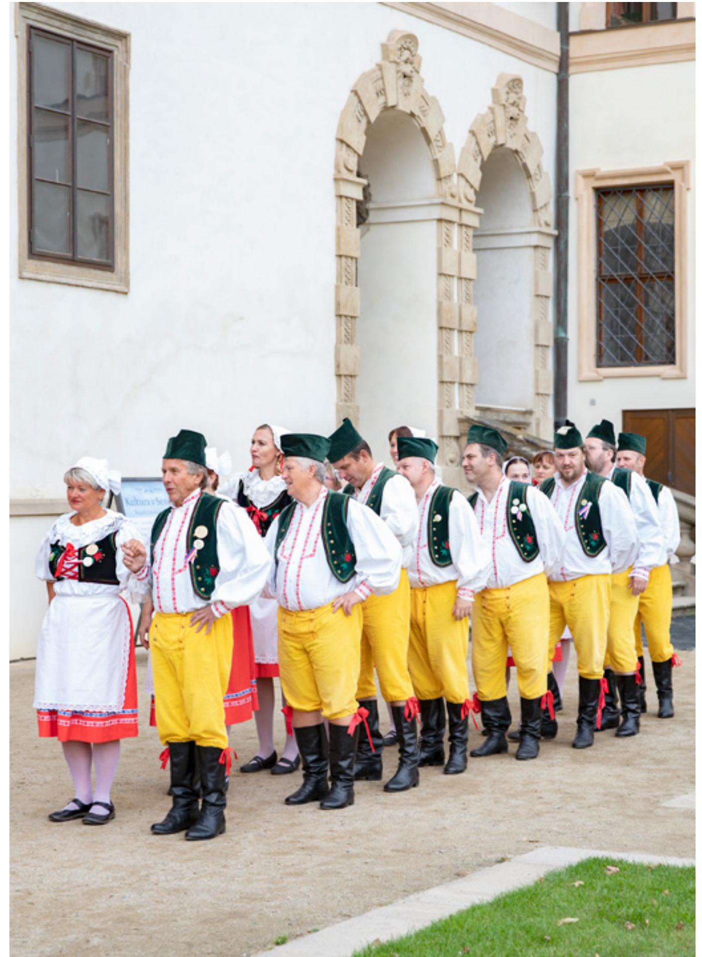
I v roce 2021 pokračovalo tradiční Kulturní léto , které Valdštejskou zahradu oživilo vystoupeními regionálních uměleckých spolků.