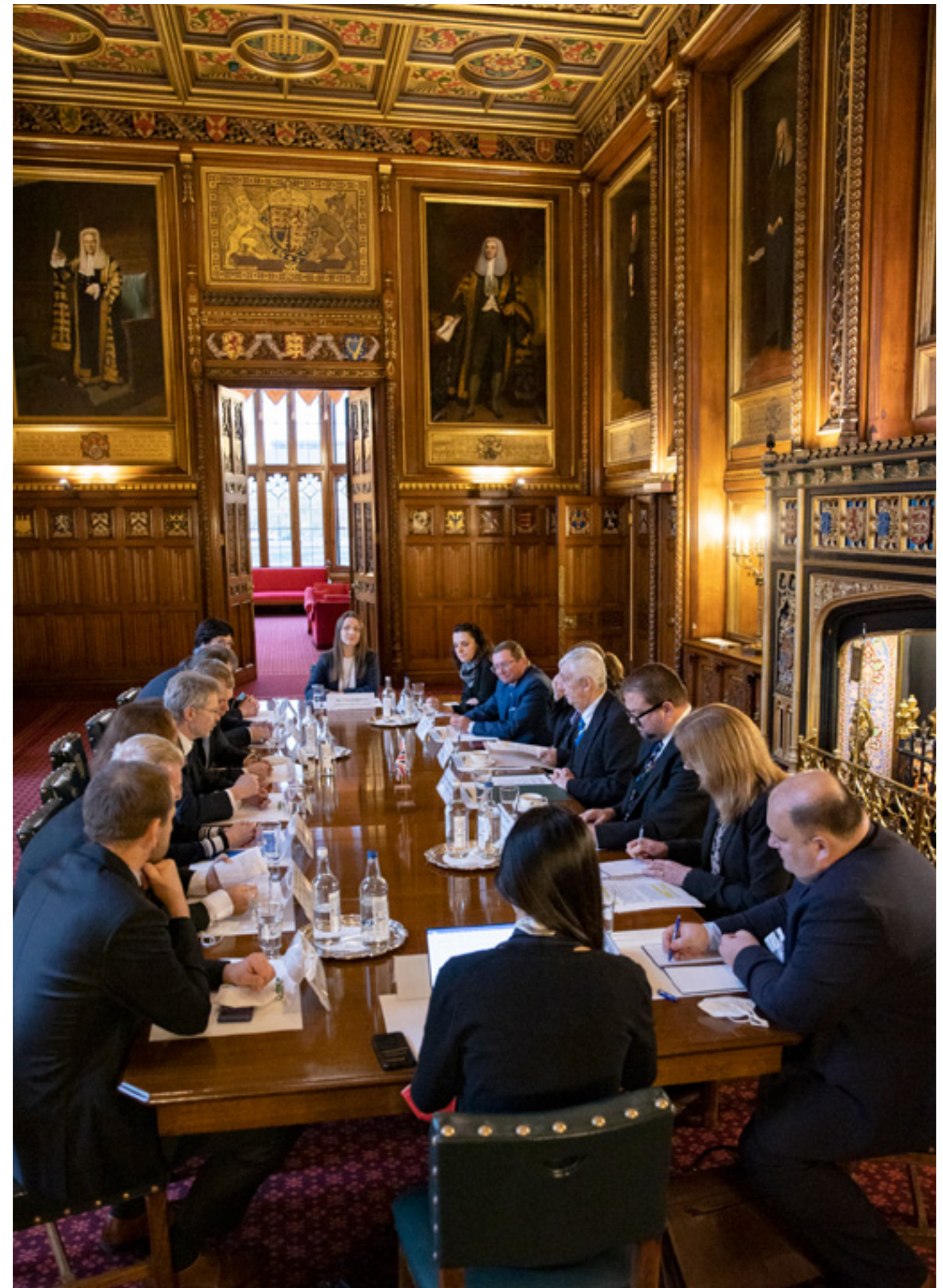
Česká senátní delegace se svými parlamentními protějšky při návštěvě Spojeného království Velké Británie a Severního Irska.