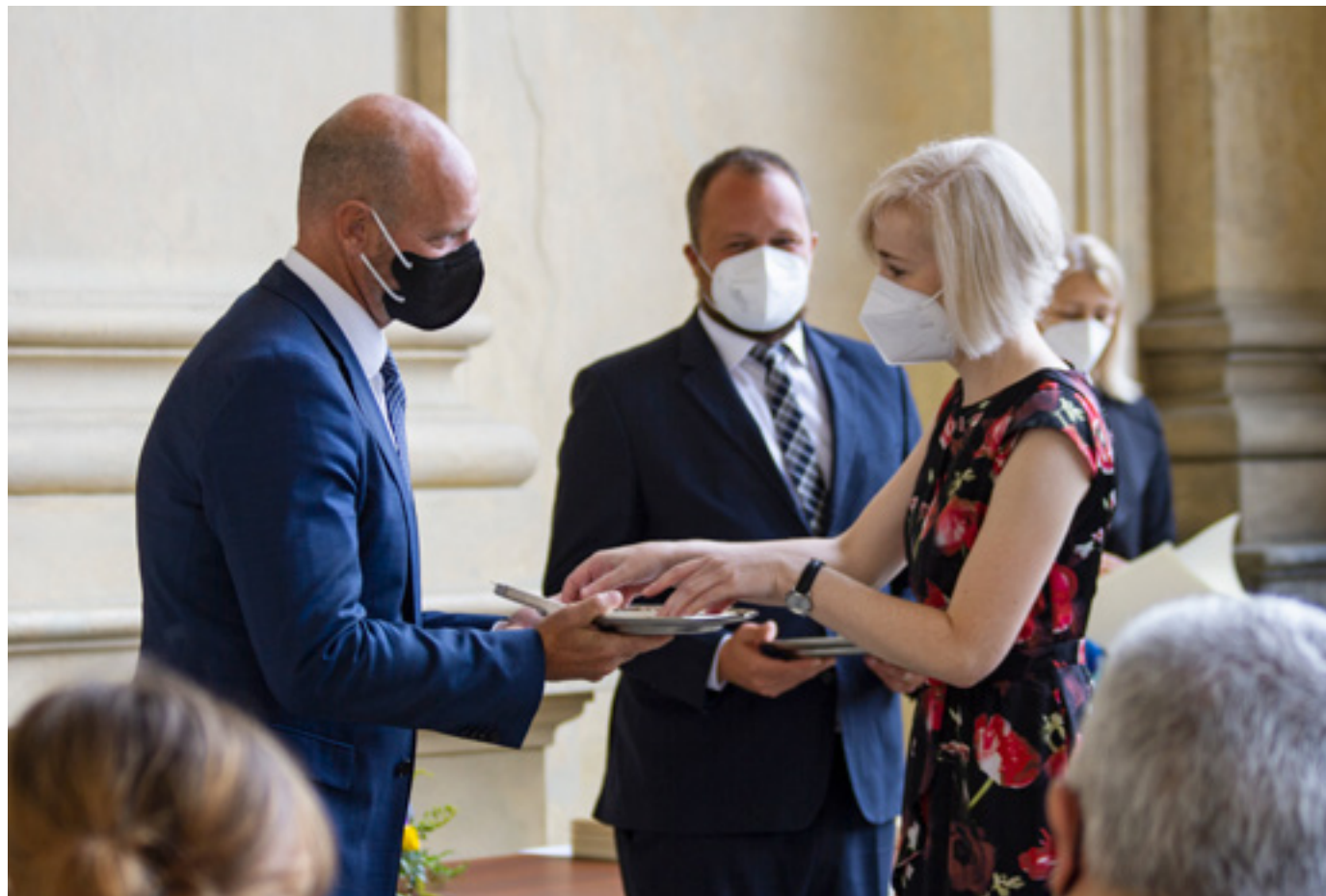
Významné osobnosti pedagogiky převzaly v Senátu Medaile Ministerstva školství, mládeže a tělovýchovy.