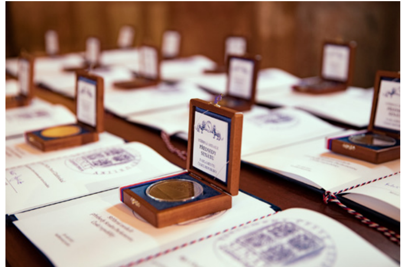
Na státní svátek 28. září byly již podesáté uděleny Stříbrné medaile předsedy Senátu pro významné osobnosti z oblasti vědy, kultury, politiky, architektury či sportu.