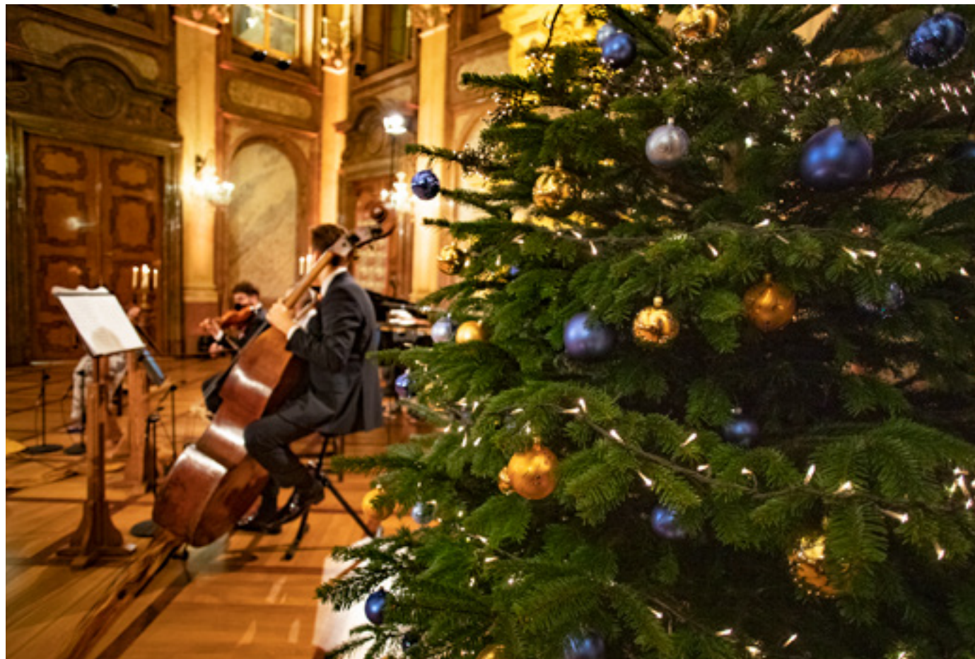
Na Vánoce se v Senátu již tradičně uskutečnil vánoční koncert, který mohli zájemci sledovat na Štědrý večer v přenosu České televize.