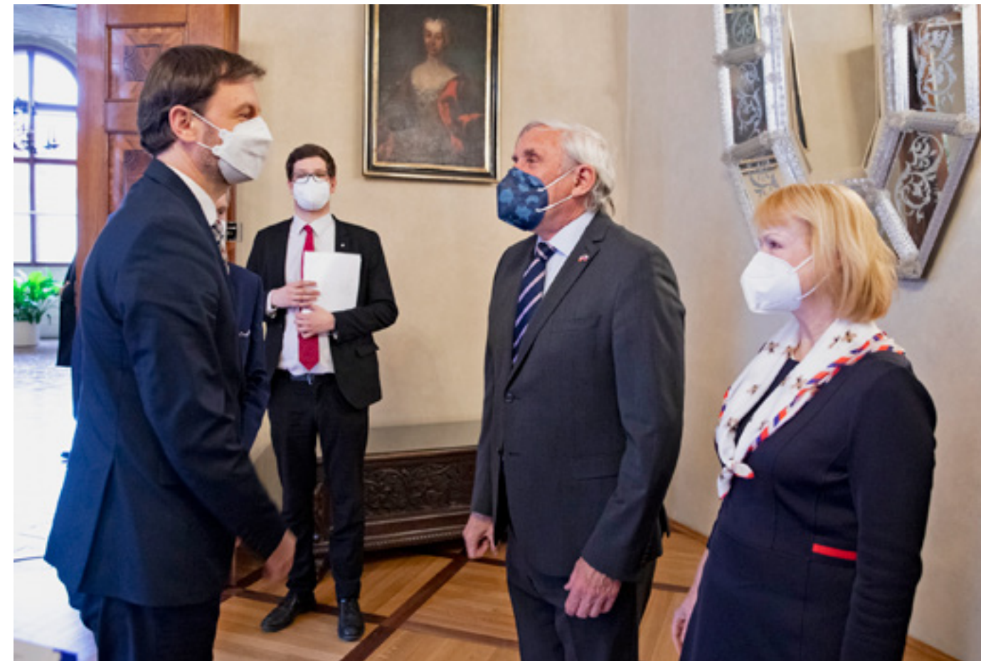
Oficiální návštěva slovenského premiéra Eduarda Hegera v českém Senátu. Na snímku s 1. místopředsedou Jiřím Růžičkou a místopředsedkyní Jitkou Seitlovou.