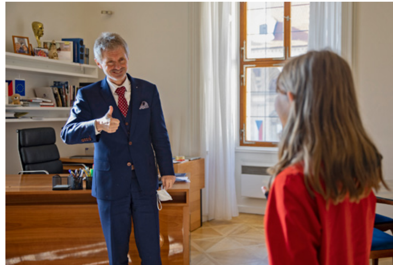
Na Dni otevřených dveří přivítal návštěvníky Senátu i jeho předseda Miloš Vystrčil.