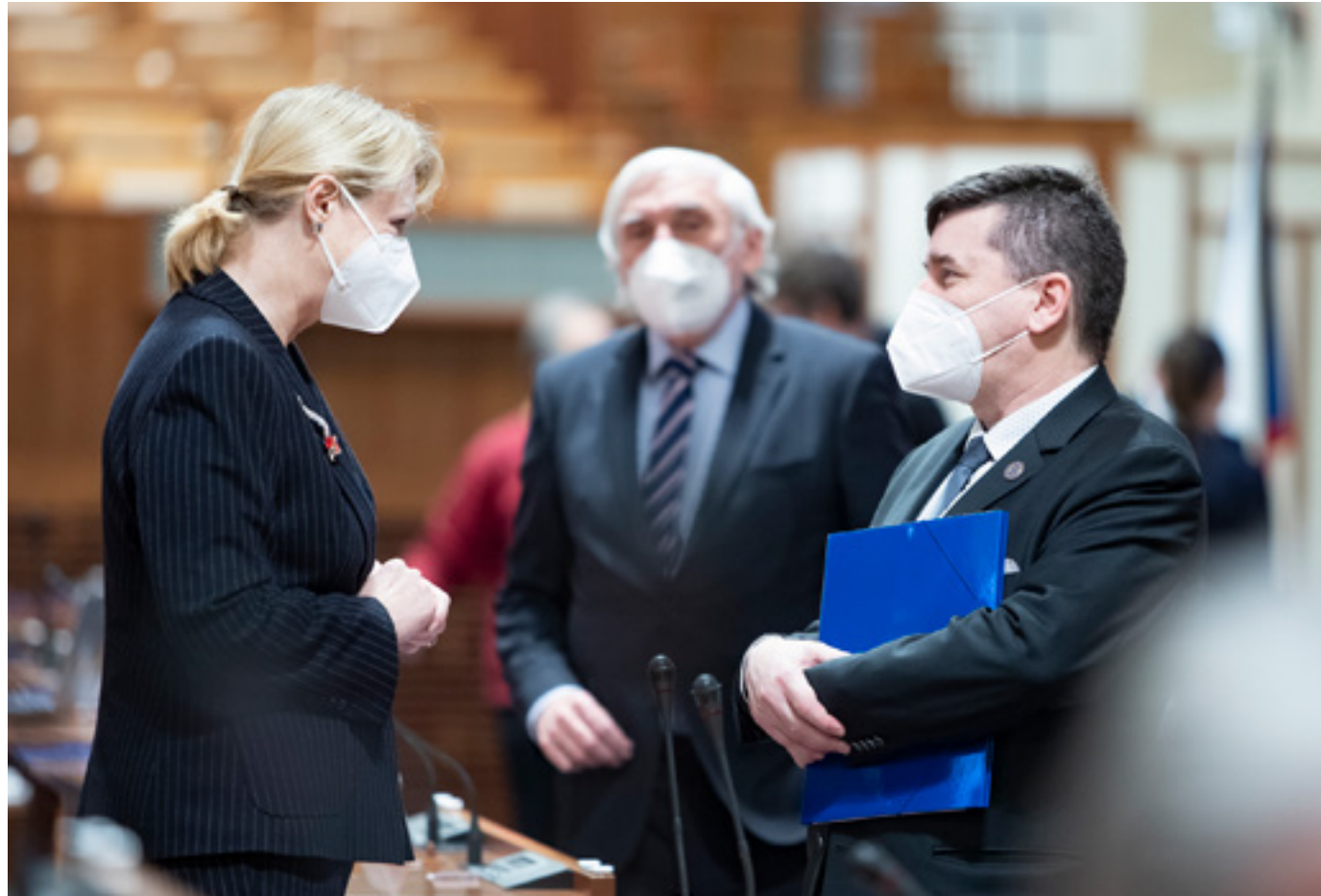
Společné jednání vedení Senátu a Poslanecké sněmovny o podobě volebního zákona.