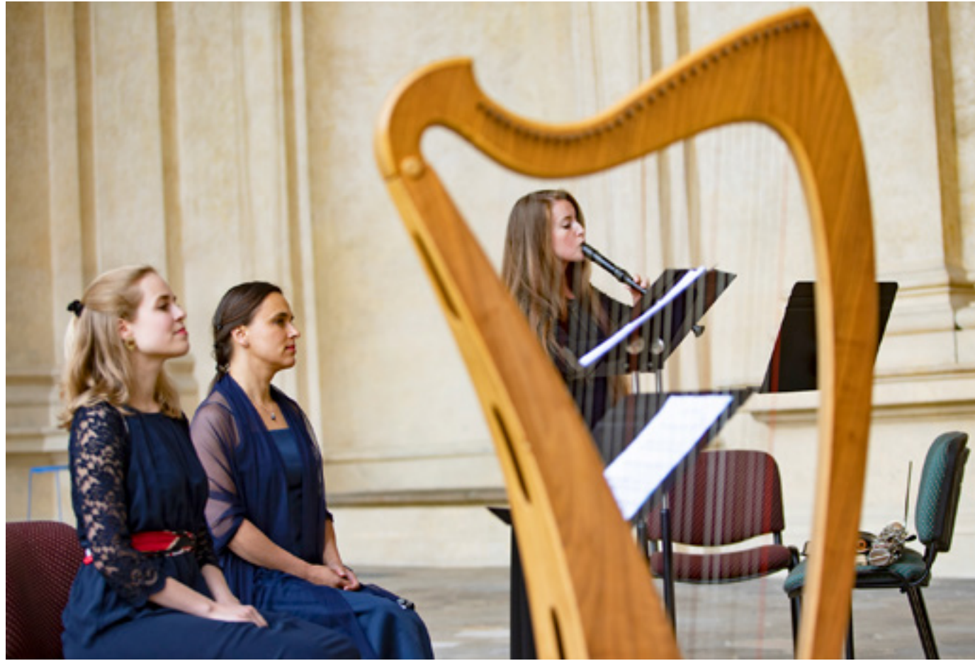
Kulturní léto nabízí pravidelný program v zahradě pro širokou veřejnost. Snímek z literárně hudebního pořadu Překrásná lovkyně Diana .