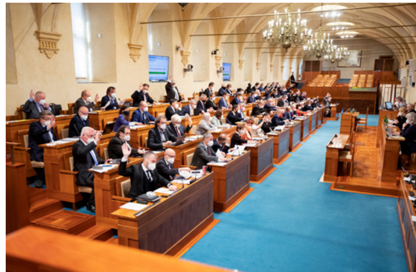
Senátorky a senátoři na 10. schůzi ve 13. funkčním období.