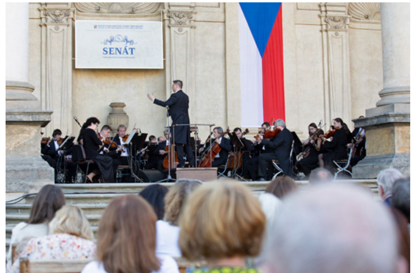
V létě vystoupil ve Valdštejské zahradě již poněkolkáté i Symfonický orchestr hl. m. Prahy FOK.