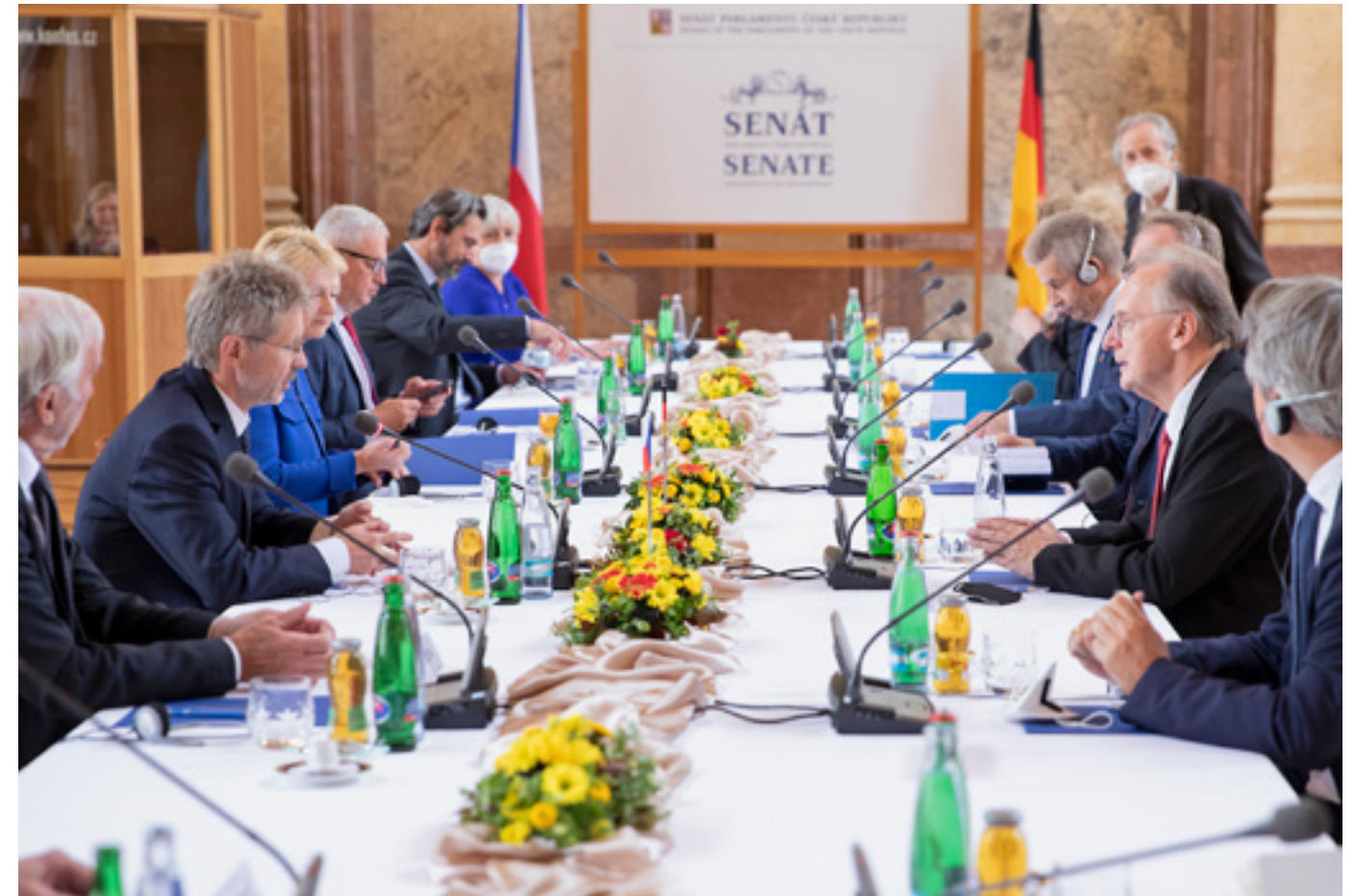
Přijetí předsedy Spolkové rady Německa Reinera Haseloffa.