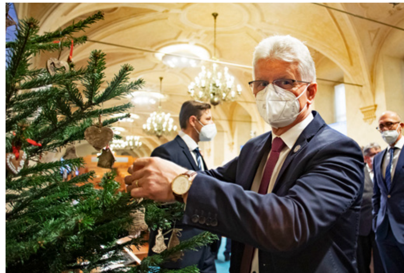
Poslední schůze Senátu před Vánocemi se uskutečnila 15. prosince.