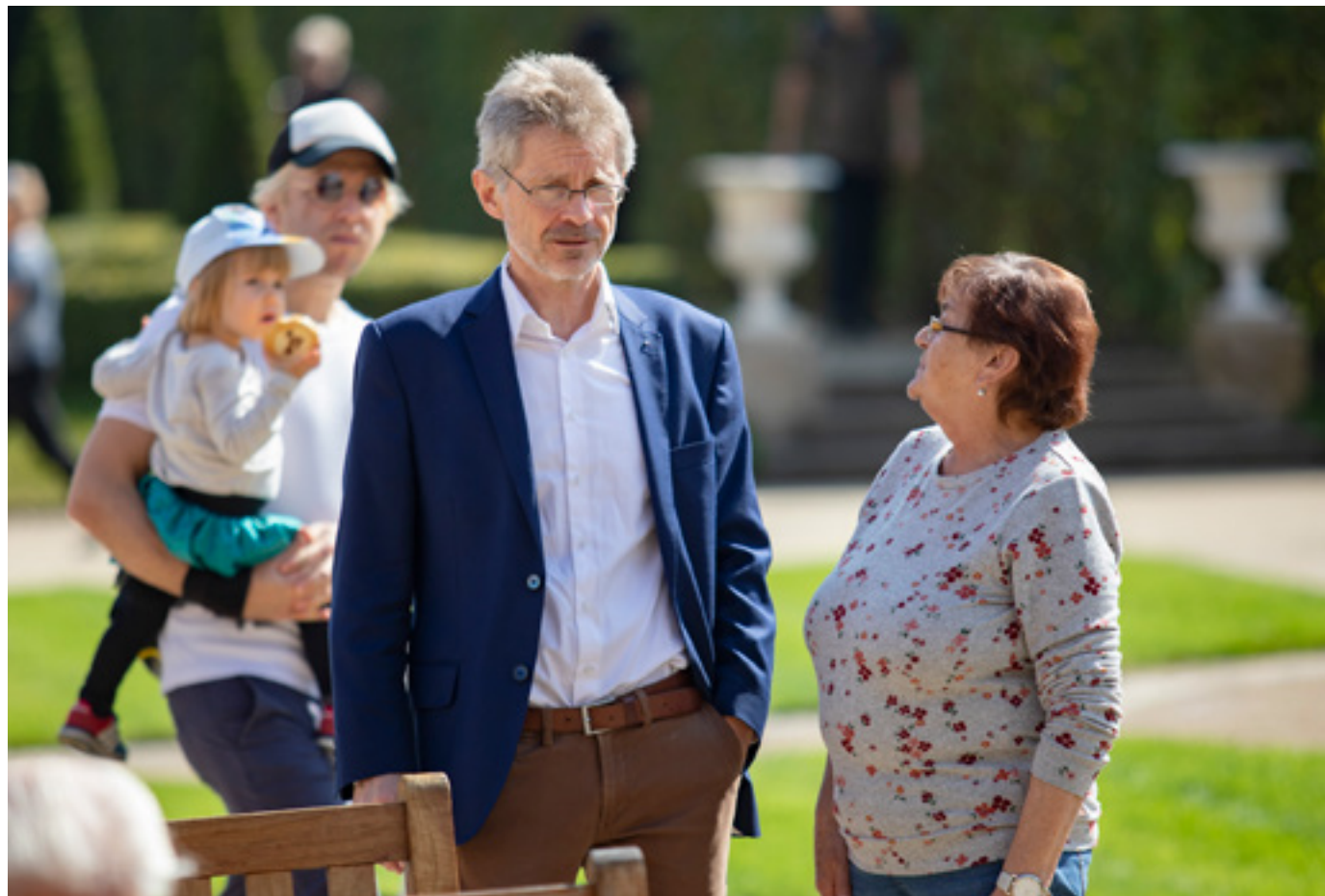
Setkání senátorek a senátorů s veřejností využili občané k diskuzím se svými zástupci.