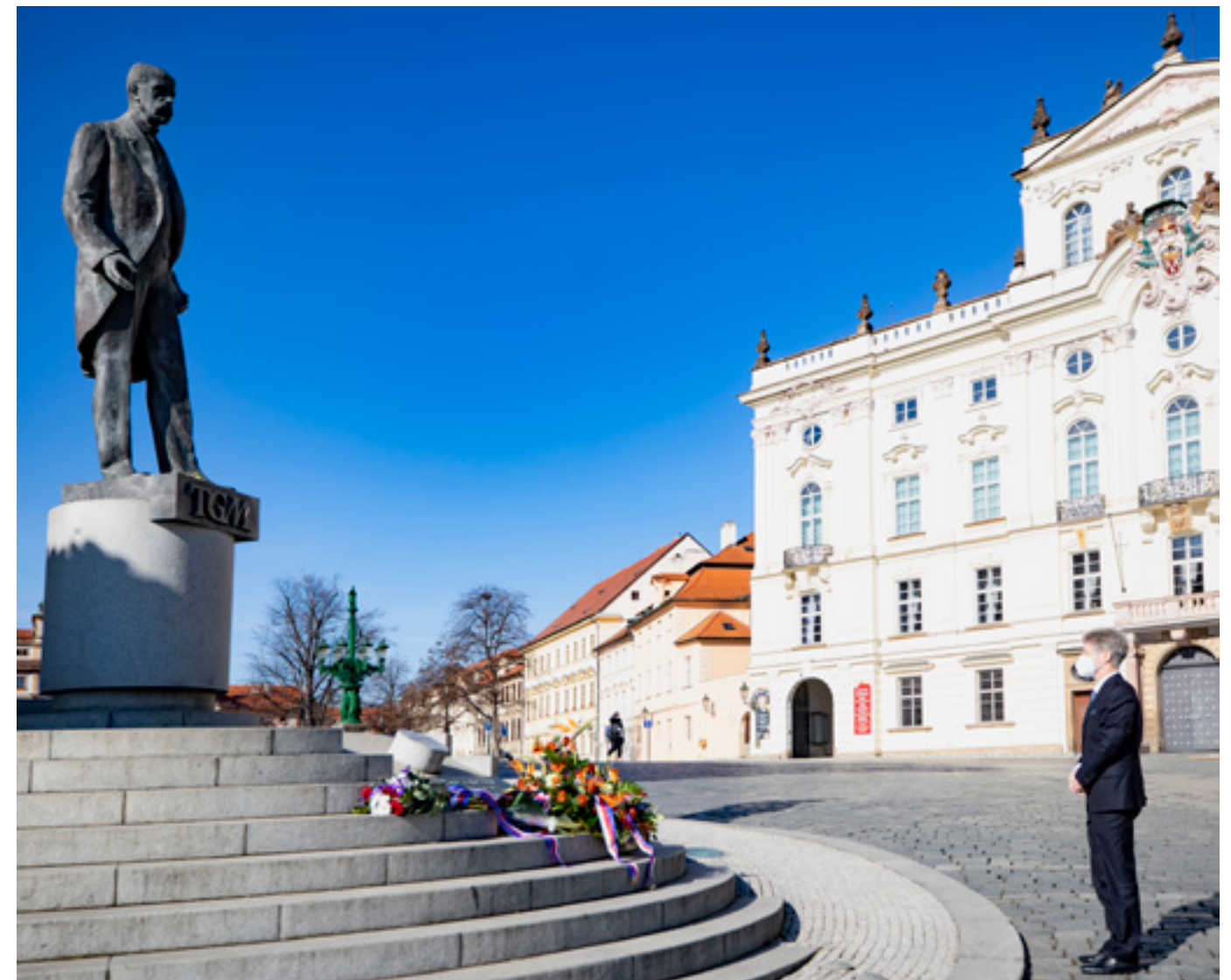
Předseda Senátu uctil památku Tomáše G. Masaryka u jeho sochy na Hradčanském náměstí v Praze.