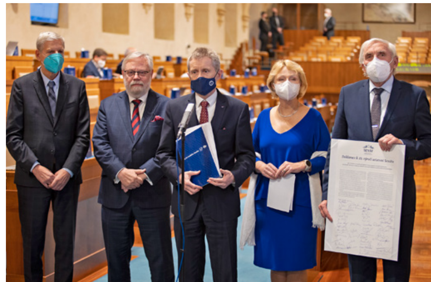
Senát si na ní připomněl 25. výročí od své historicky první ustavující schůze, která se konala 18. prosince 1996. U této příležitosti vznikla deklarace, k níž senátorky a senátoři připojili své podpisy.